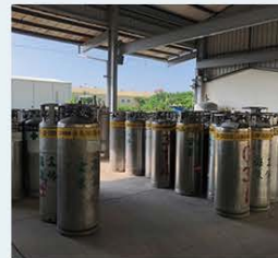
■ 液態氮大桶裝分裝桶