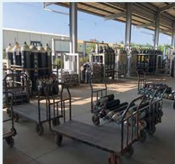
■ 小型醫用氣體儲放瓶